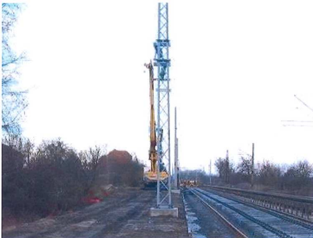
Vŕtanie a betonáž pilót pre PHS – SO 11-34-04