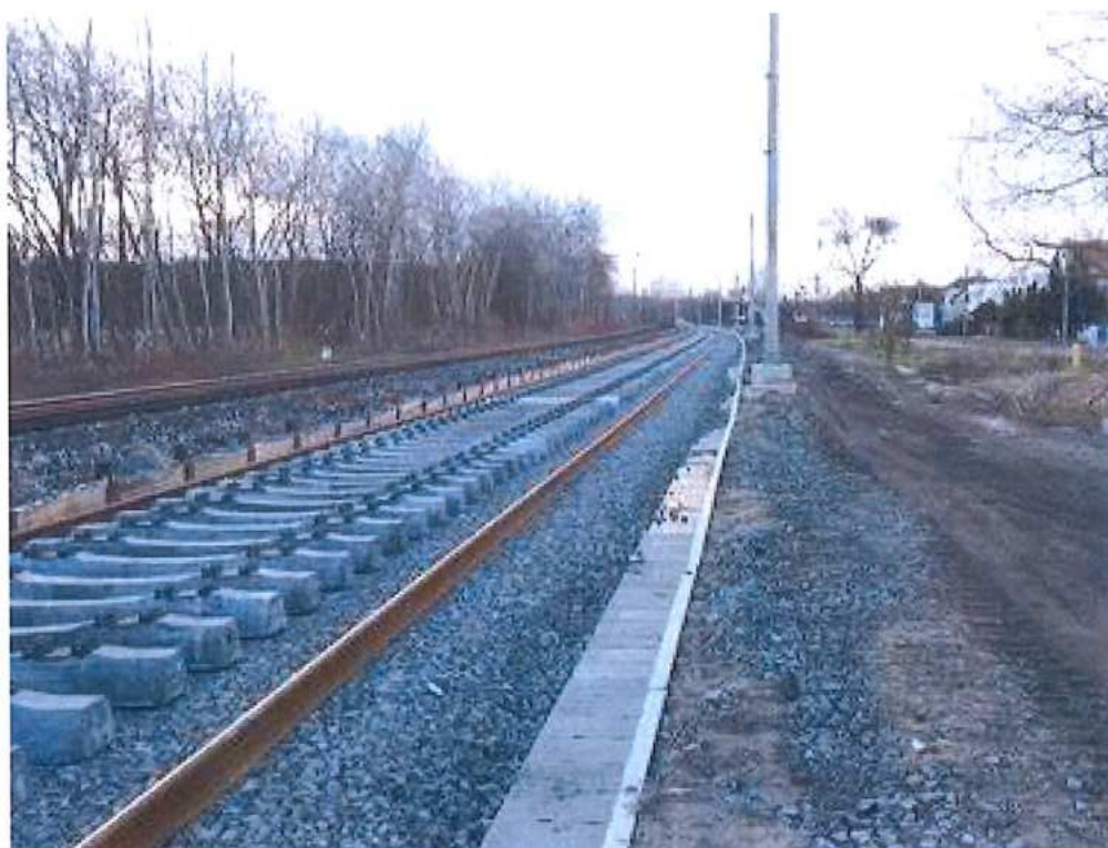
Pokládka betónových podvalov a montáž koľajnicových pásov – SO 11-32-01