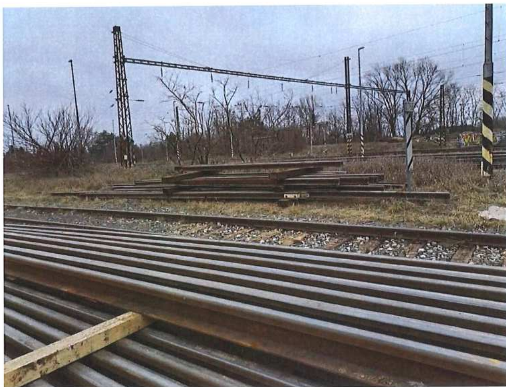
Demontáž koľajových polí – SO 02-32-03