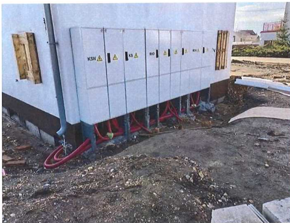
Montáž napojenia technologického domčeka – SO 11-35-04