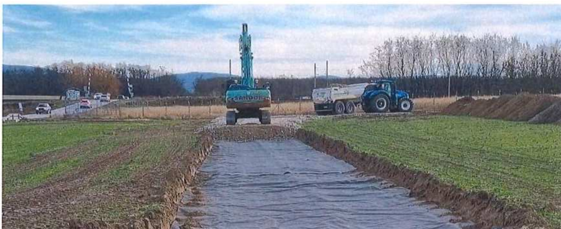
Rozprestretie geotextílie - realizácia prístupových ciest SO 01-32-02