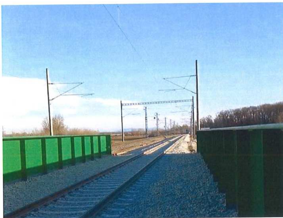
Montáž TV – SO 12-35-01