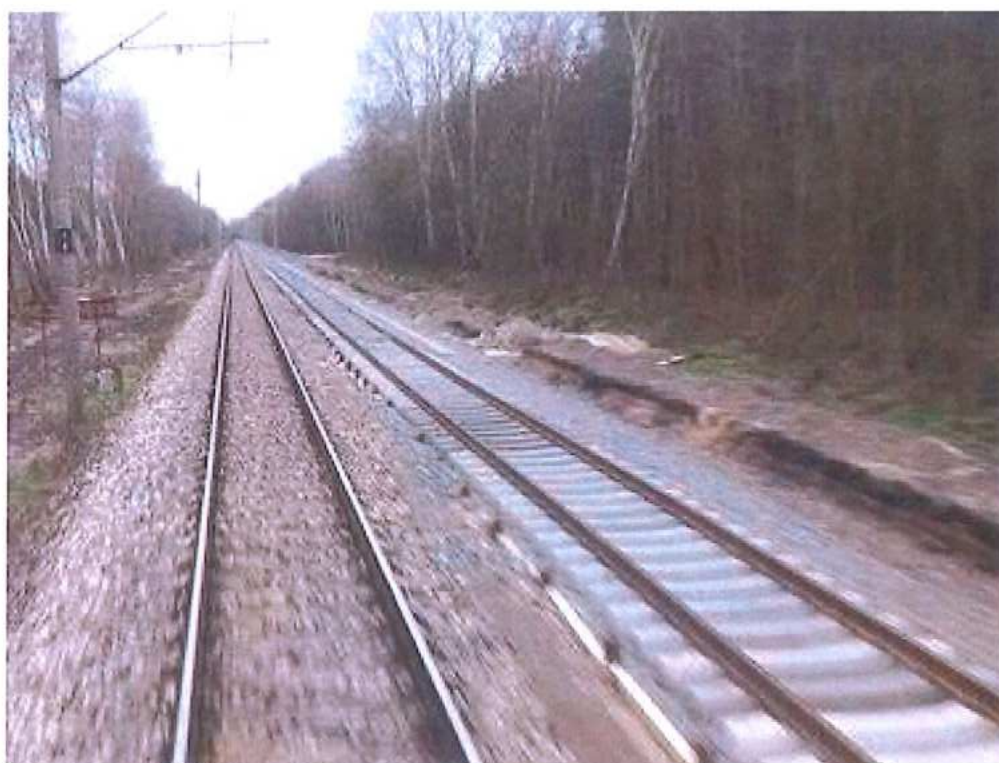
Pokládka betónových podvalov a montáž koľajnicových pásov – SO 10-32-01