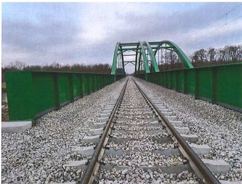
Doplnenie koľajového kameňa – SO 12-32-01