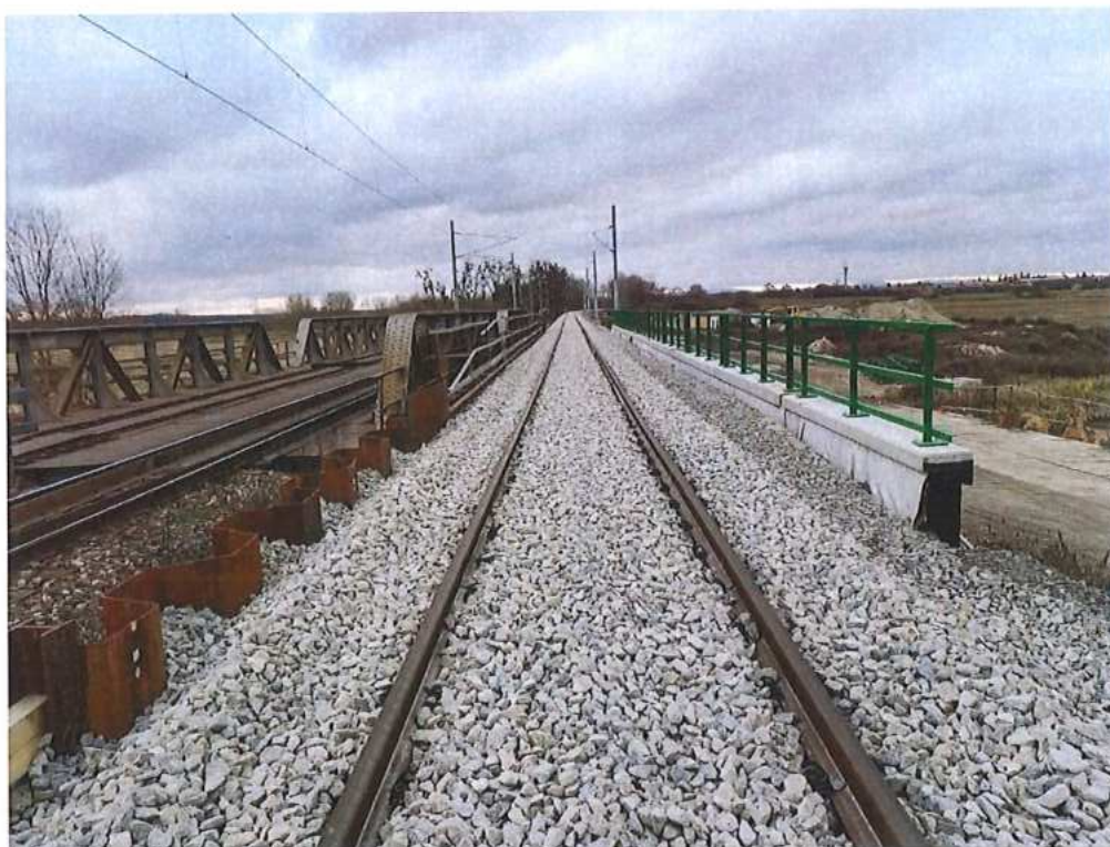
Doplnenie koľajového kameňa – SO 12-32-01