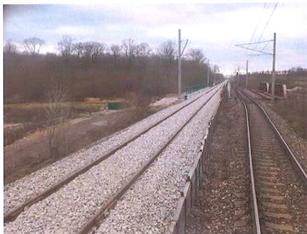
Predštrkovanie– SO 12-32-01