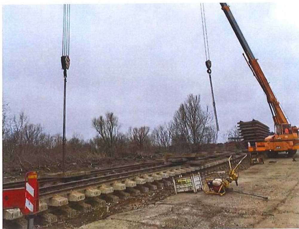
Demontáž koľajových polí – SO 02-32-03