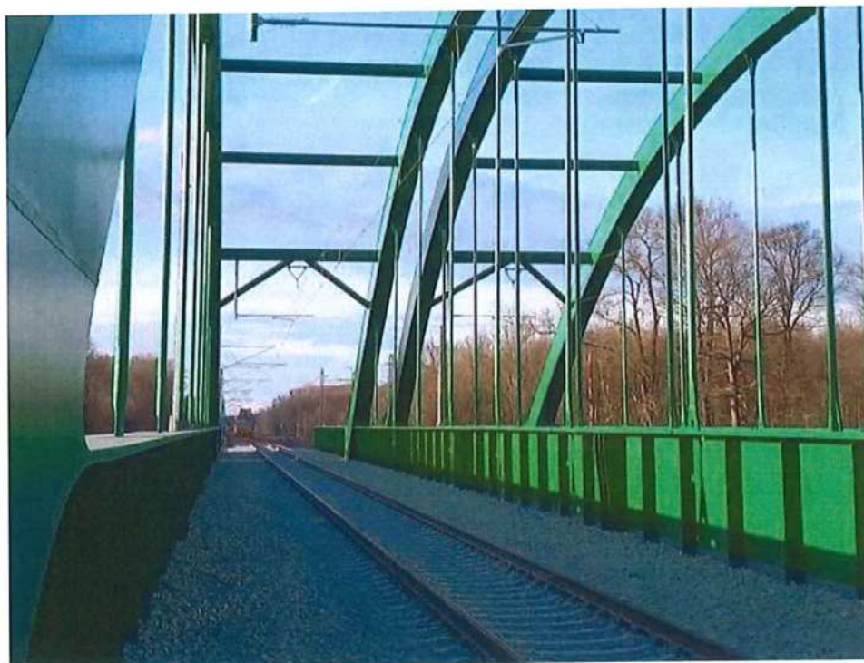
Montáž TV – SO 12-35-01