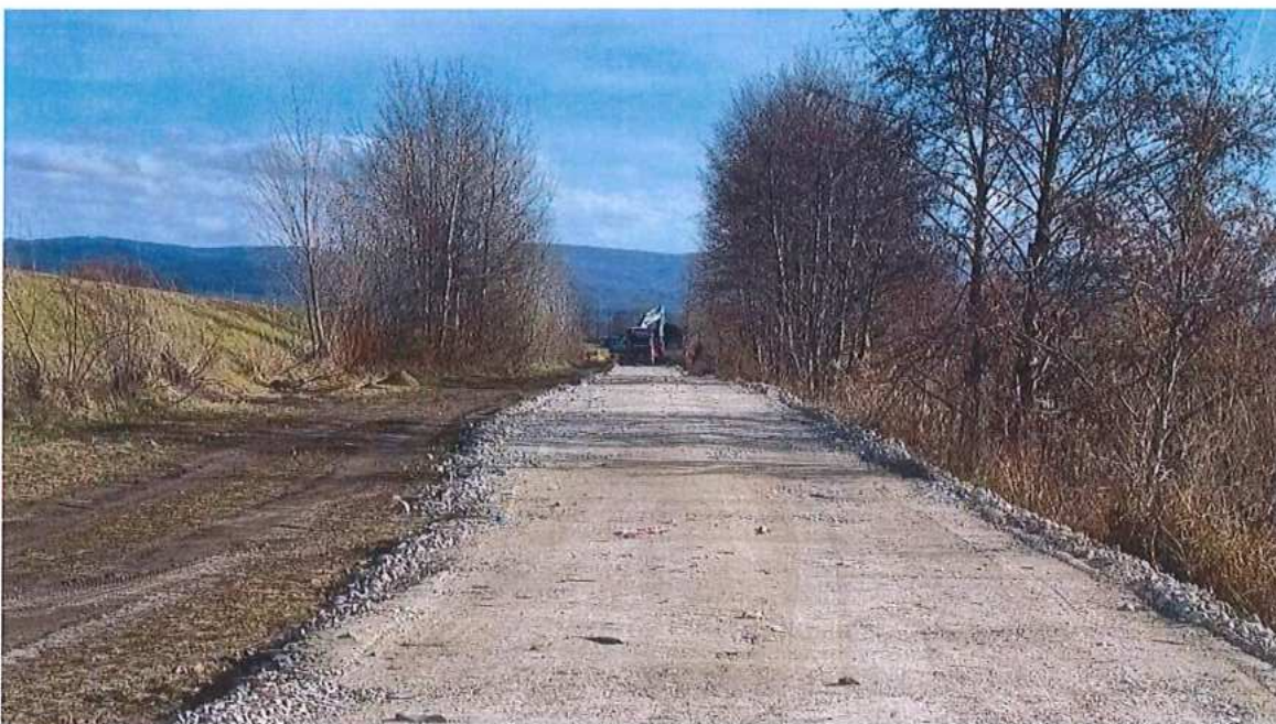
Realizácia konštrukčných vrstiev zo štrkodvy - realizácia prístupových ciest SO 01-32-02