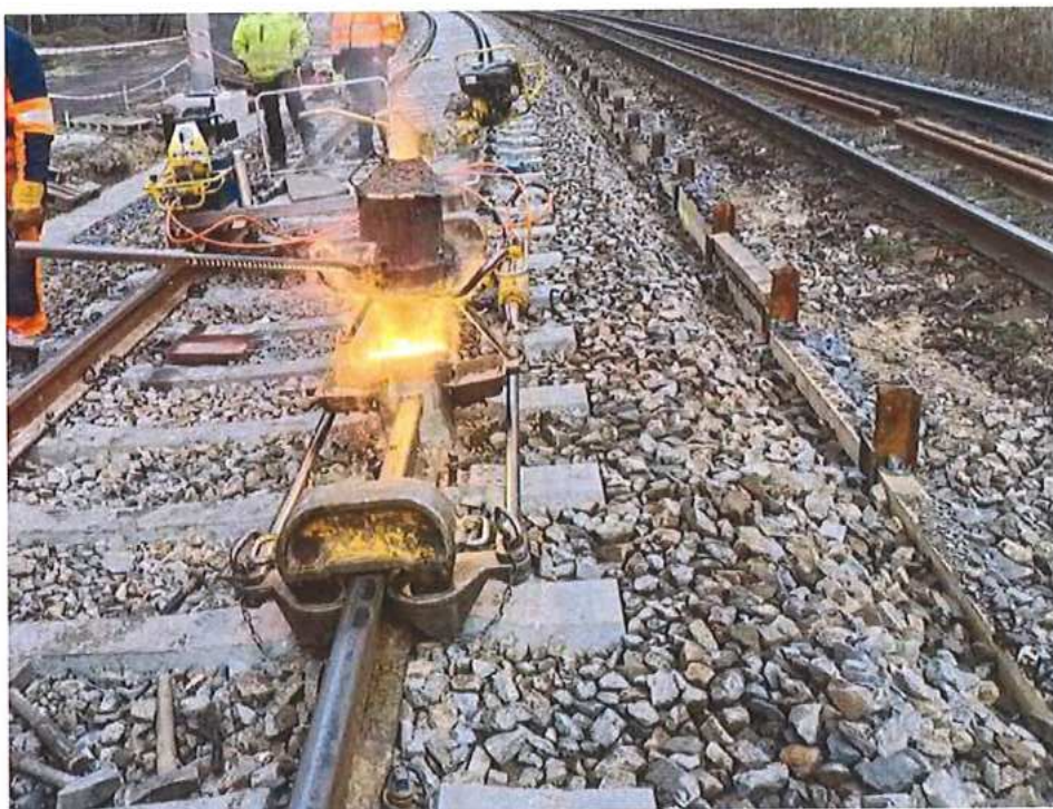
Zváranie koľajníc – SO 10-32-01