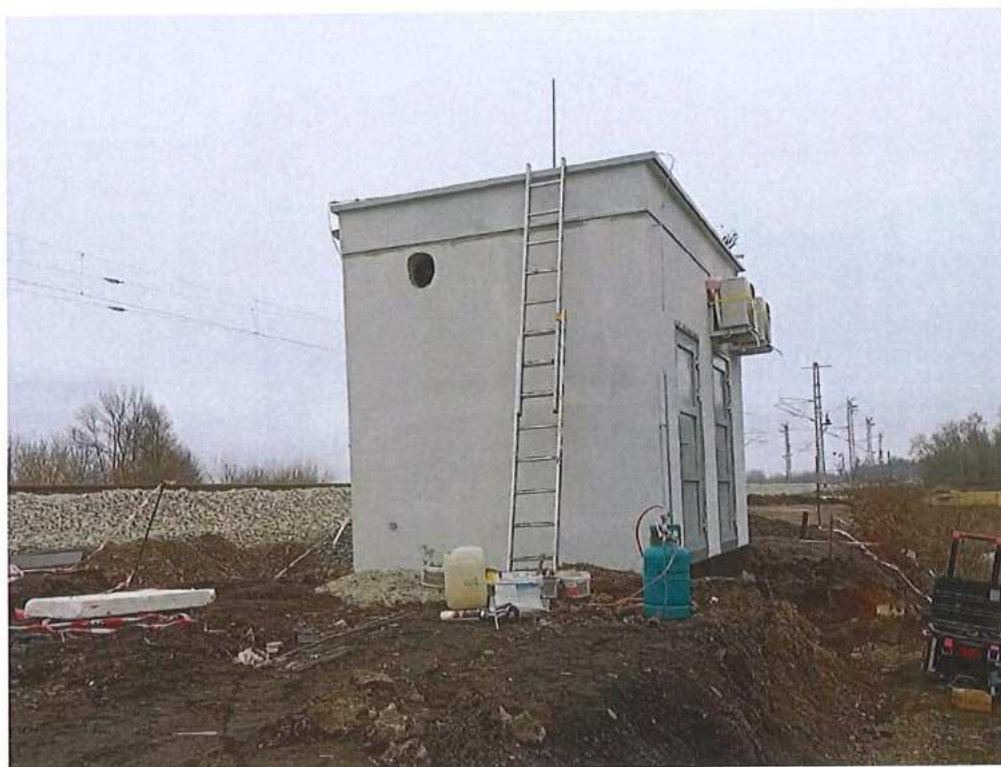
Osadenie technol. kontajnera – SO 12-34-01