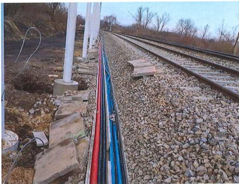
Pokládka káblov do KCHT - SO 12-35-06, 10-21-01, 11-22-03