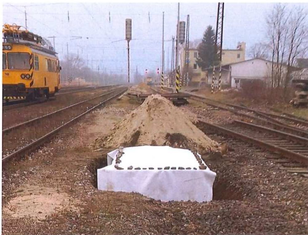
Betonáž základov trakč. podpier – SO 02-35-01