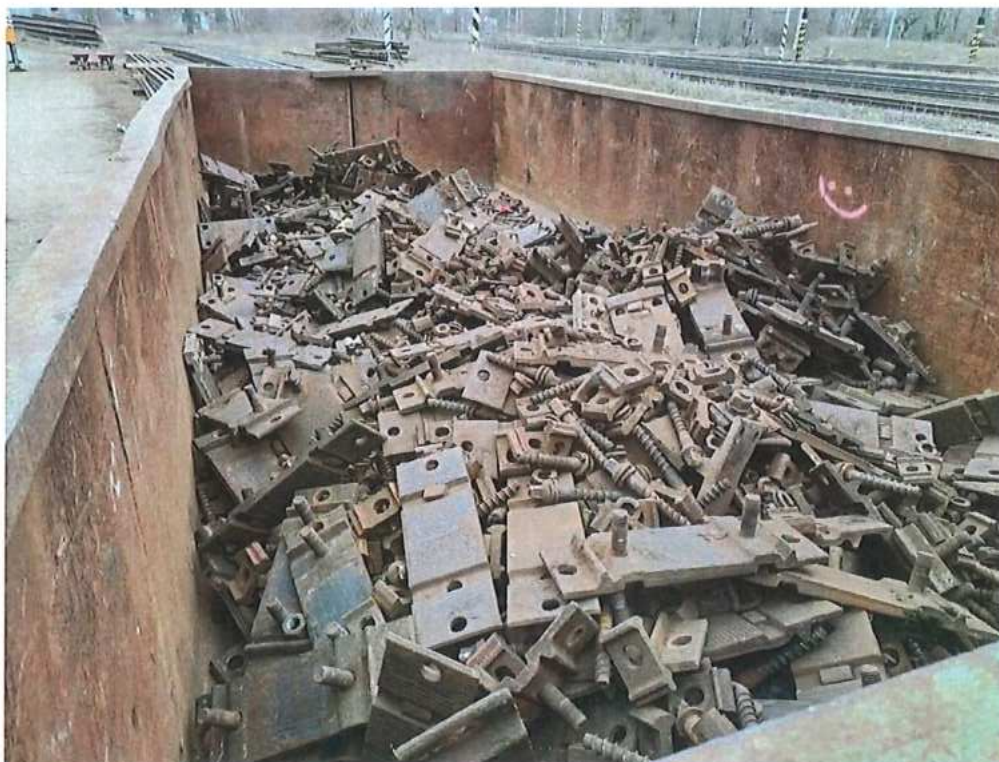
Zdemontovaný drobný materiál – SO 02-32-03