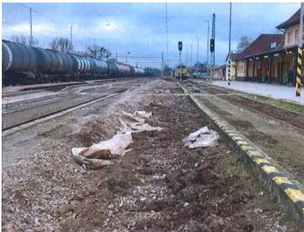
Demontáž TK5 – SO 02-32-02