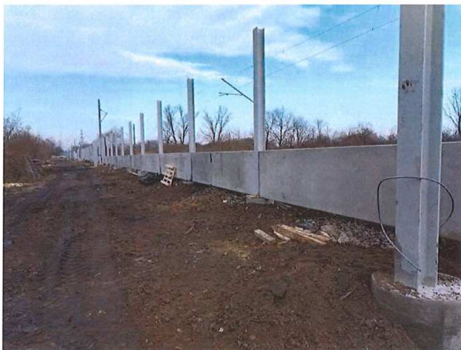
Osadenie stĺpov PHS + panely – SO 11-34-01