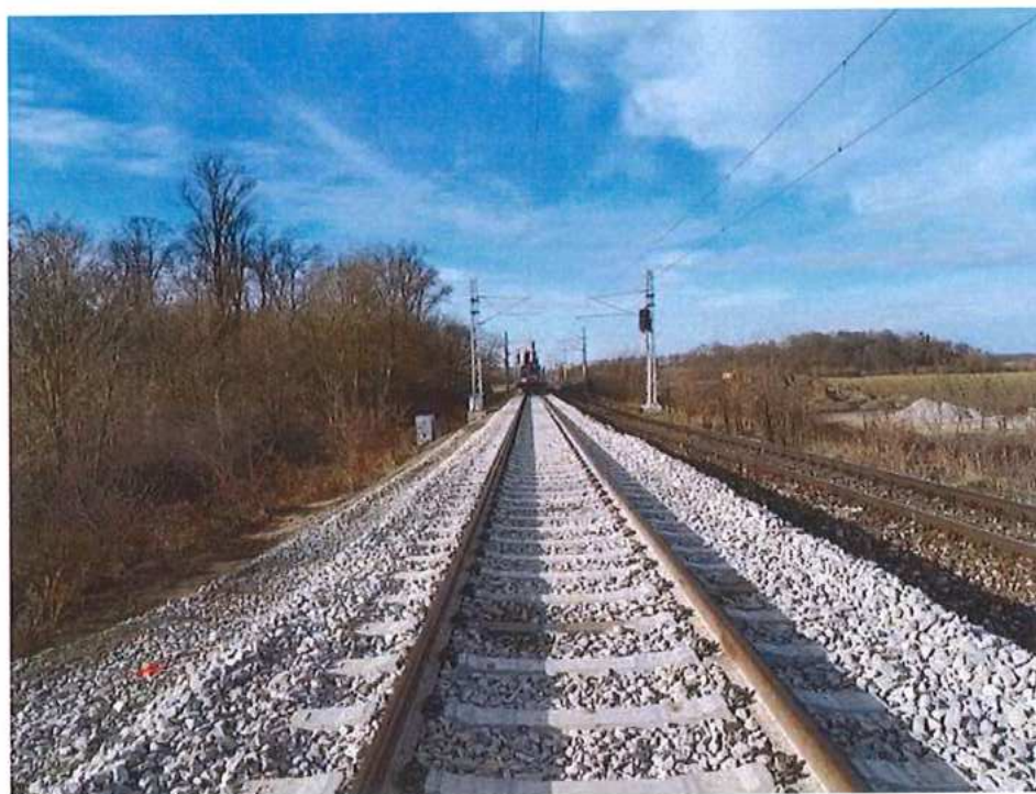
Montáž TV – SO 12-35-01