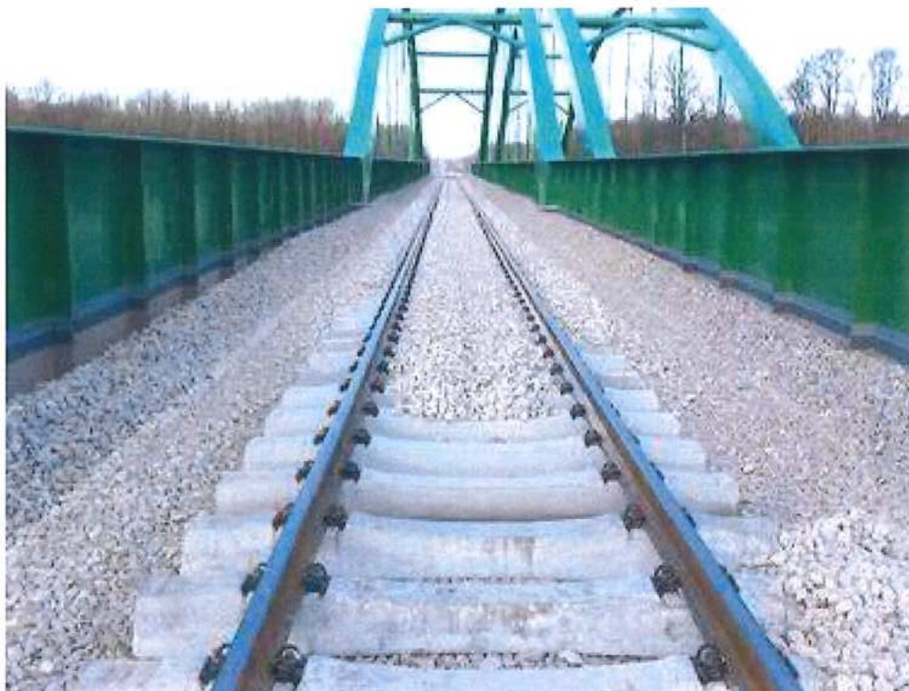
Predštrkovanie– SO 12-32-01