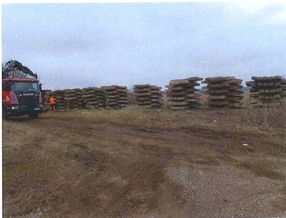
Demontáž koľajových polí – SO 02-32-03