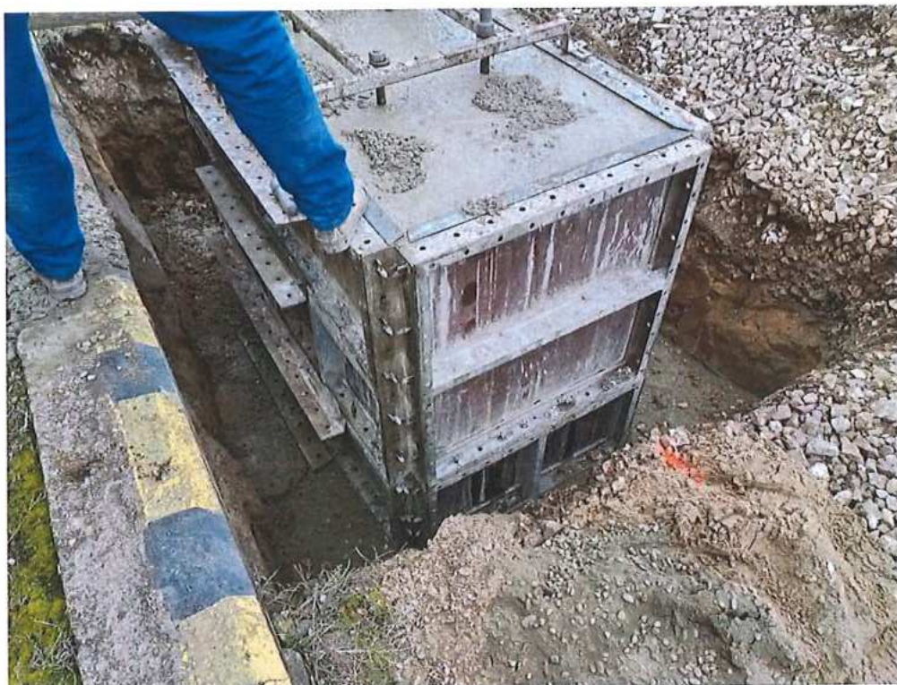
Betonáž základov trakč. podpier – SO 02-35-01