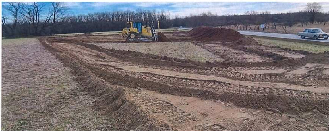
Odstránenie ornice - realizácia prístupových ciest SO 01-32-02