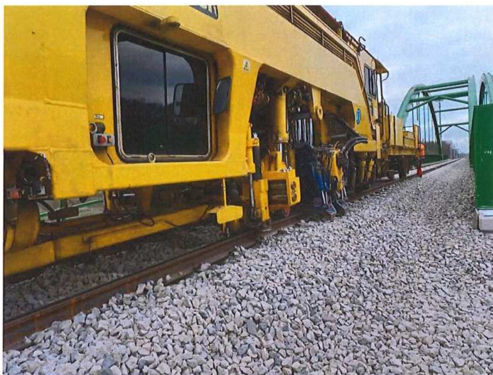
Podbíjanie – SO 12-32-01