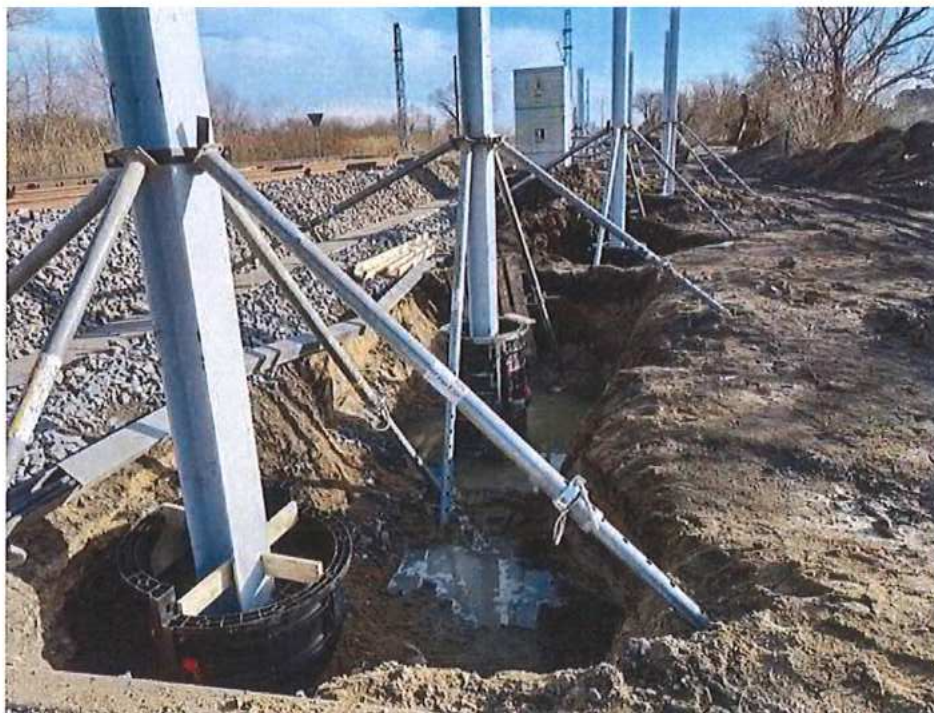
Osadenie stĺpov PHS – SO 11-34-01